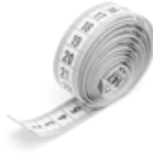
Una cinta métrica