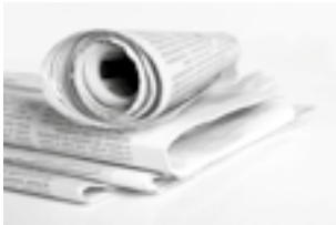
6 hojas de periódico