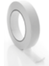
Un rollo de masking tape